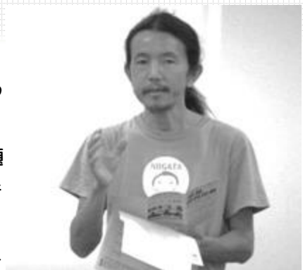
原発県民投票準備会発起人 請求代表者 さいたま市

最近、地方自治体の議員や首長の不祥事が巷を騒がしています。議員が当選さえすればいいと考えているからか、市民が選挙に行くだけであとはお任せにしているからか。民主主義を醸成するためには市民が意見を言い、意思表示をする必要があります。そのためには、決定権がなくてはなりません。言っても無駄だと思っていたら何も言わなくなってしまいます。住民投票では一人一人が一つのテーマに向き合い、考え、意思表示をする機会となります。その結果を議会が尊重することで民主主義が醸成されていくと思います。