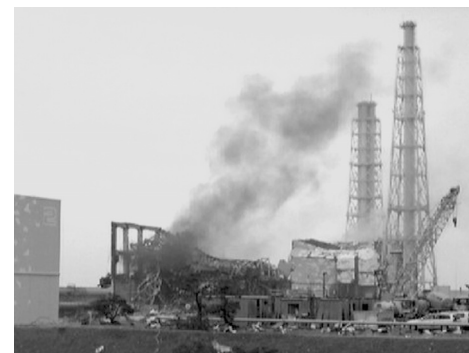
福島第一原発3号炉の爆発跡(2011年3月16日)

私たちは条例の直接請求を住民の権利行使の仕組みとして、また、「原発埼玉県民投票」を世界と次の世代のため、自らに課せられた今に生きる者の責任として取り組みます。